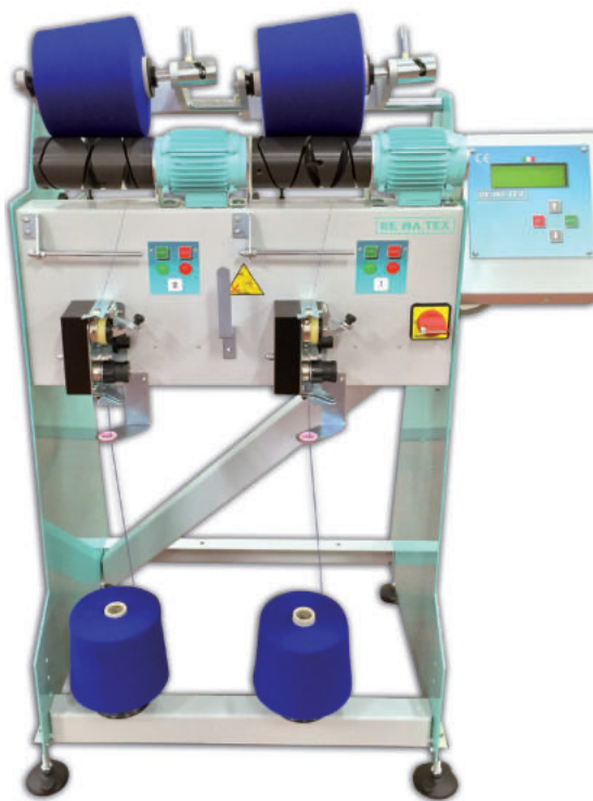
Mod. CA-2 de 2 husos

Apta para rebobinar, produciendo bobinas parafinadas y con medición exacta